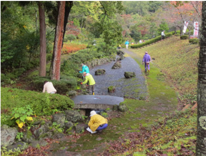
池周辺の草を鎌で手際よくとっていき皆さん！

10月27日(日)に古墳公園池周辺で行われた草刈りボランティア。丹生高校 PTA 親子ボランティアと共同開催することで、16名のエネルギッシュな高校生にもご協力をいただき、とても綺麗になりました。古墳公園がふるさとの宝となるよう今後もボランティア活動等による公園周辺の再生を続けて参りますので、皆さまのご理解とご協力をよろしくお願いいたします。