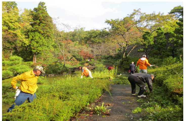
自分の持ち場をきれいに刈り取っていきます。