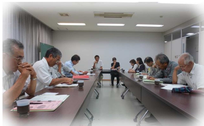
H25.10.1 (火) 第6回部会にて 事業についてディスカッションしています。