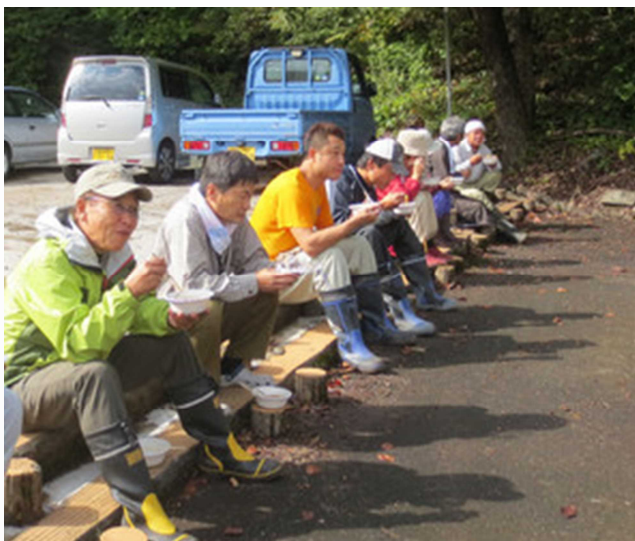
作業後の豚汁とおむすびは最高！